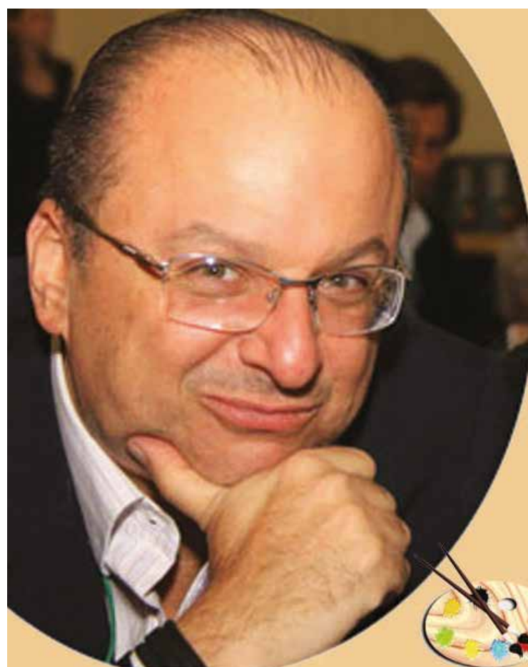
POR OVADIA SAADIA