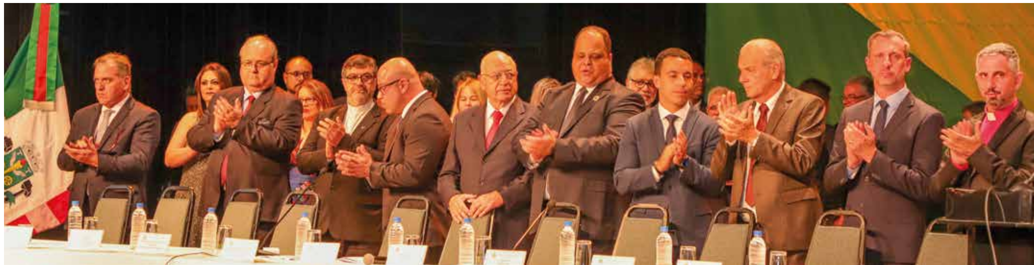
Cerimônia aconteceu no Teatro Municipal Glória Giglio na noite da última sexta-feira