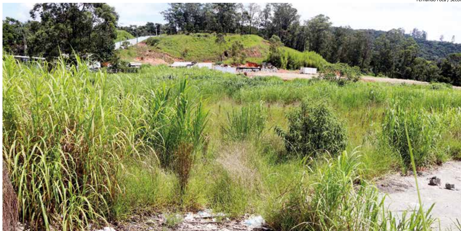
Manutenção de terrenos deve ser frequente

Um terreno mal cuidado é um problema que causa transtornos, o mato alto, os dejetos e os entulhos que normalmente se acumulam nesses locais tornam-se criadouros de ratos, baratas, cobras, escorpiões e o temido Aedes aegypti , mosquito transmissor da dengue e da febre amarela. “É uma questão ambiental, sanitária e estética. Você vai no local e tem mato, vegetação alta, dá impressão de abandono, ou seja, é um problema urbanístico. Ao mesmo tempo, nessa época de chuvas, torna-se também uma questão ambiental e sanitária porque se você não cuida, assim como o lançamento de resíduos, vão apare-