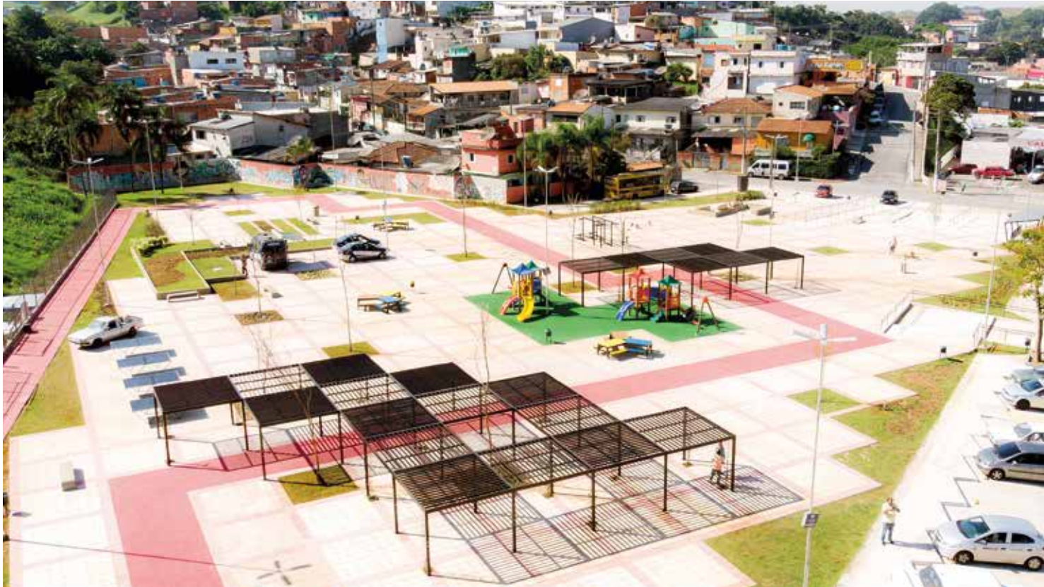
A praça fica em um terreno com área de 7 mil metros quadrados e será aberta oficialmente nesta sexta-feira, 31 de maio

“Faltava lazer para as crianças. Agora tem brinquedos e