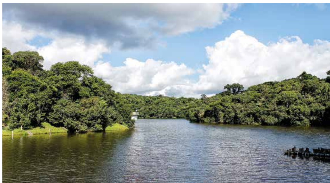
O Dia Mundial do Meio Ambiente foi criado pela ONU na década de 70

assuntos relacionados ao Meio Ambiente para os jovens assistidos pelo Centro de Referência Especializado de Assistência Social (CREAS Caucaia do Alto)