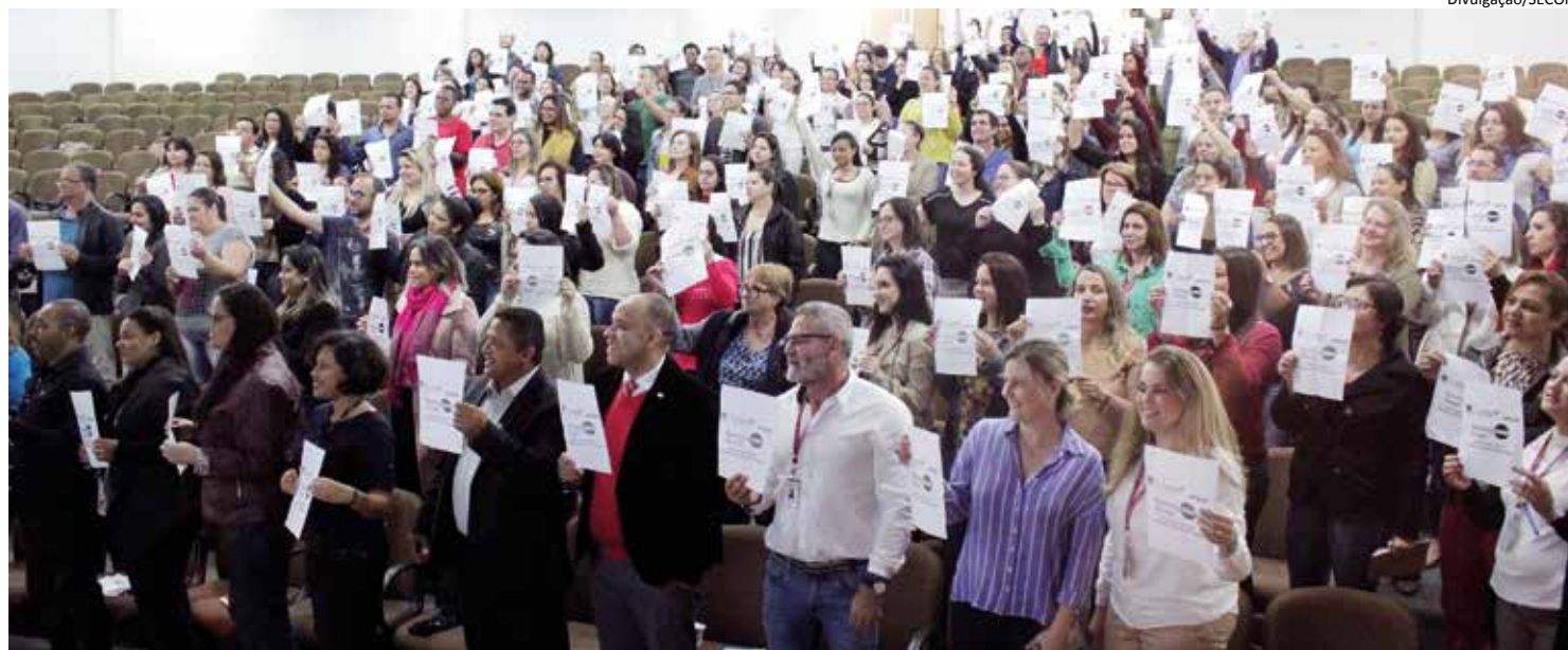
Os dados foram apresentados durante Audiência Pública promovida pela Secretaria de Saúde de Barueri

Só as 18 Unidades Básicas de Saúde (UBSs) somaram 562.996 atendimentos, sendo 142.789 somente em consultas médicas. Os demais procedimentos chegaram a 420.207. As especialidades médicas, existentes nas UBSs e no Ambulatório de Especialidades, registraram 68.281 atendimentos. Barueri dispõe à sua população uma gama de 23 especialistas, mas