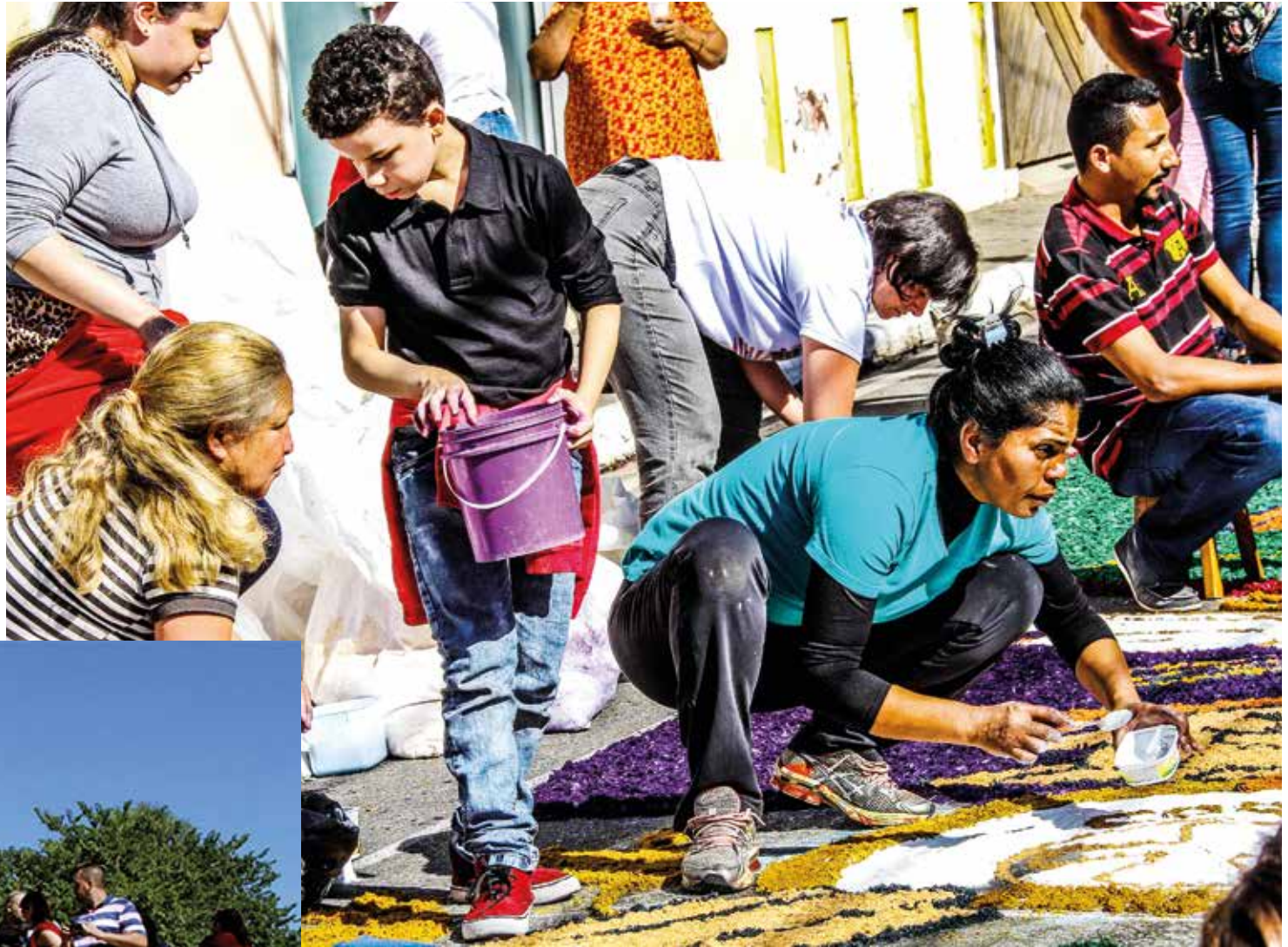
Turistas percorrem o Centro Histórico observando a confecção dos tapetes na celebração de Corpus Christi

A programação religiosa contará com 4 celebrações (missa) às 8h30, 10h30, 12h, incluindo a missa campal às 15h30, seguida da tradicional procissão pelas ruas do Centro Histórico. O evento também contará com a Feira de Artesanato e alimentação, localizada respectivamente nas ruas André Fernandes, Pedro Procópio e nas Praças da Bandeira e 14 de Novembro. De acordo com a organização do evento, a expectativa é que a cidade receba mais de 50 mil visitantes ao