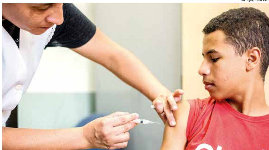
Vacina está disponível em todas as 25 UBS's da cidade e é aplicada em dias pré-definidos

ças, a partir de nove meses de idade, lactantes que amamentam bebês acima de 6 meses. Em caso de dúvidas, procurar a UBS de referência com as receitas de medicação de uso atual, pois pacientes em terapêutica imunodepressora (quimioterapia, radioterapia, corticóide em doses elevadas por mais de 2 semanas) não podem ser vacinados.