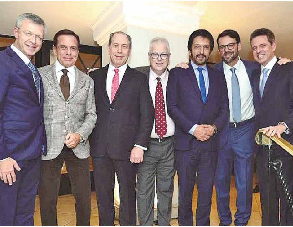
A 56ª Convenção Anual da CONIB foi muito mais do que um evento — foi uma celebração de valores que sustentam a convivência, a justiça e a esperança.

Neste fim de semana, a comunidade judaica brasileira e importantes lideranças políticas e institucionais se reuniram na Hebraica de São Paulo para reafirmar compromissos que transcendem fronteiras e tempos: a defesa da liberdade, da democracia e do respeito mútuo.